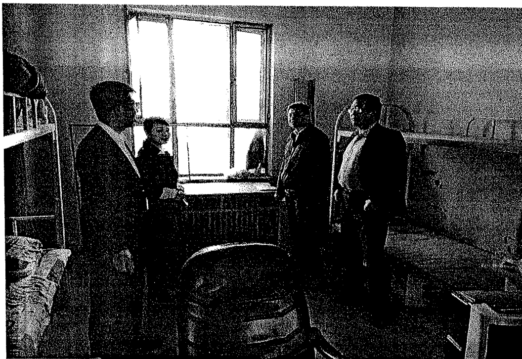
向院长和霍主任了解实习学生的住宿和伙食情况，同公司工作人员进行详细的交谈。