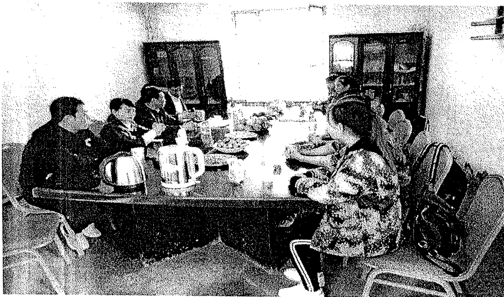
公司代表及学院领导同实习学生举行座谈会，解答实习生提出的相关问题，并听取大家的建议。