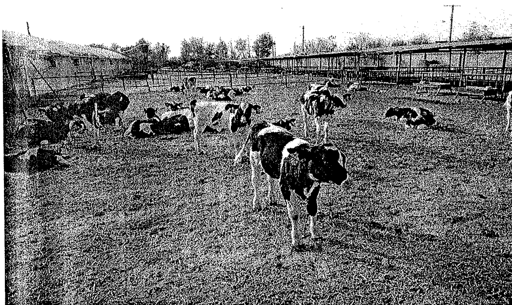
学院向院长和牧医系霍主任参观养殖场内牛犊生长情况。