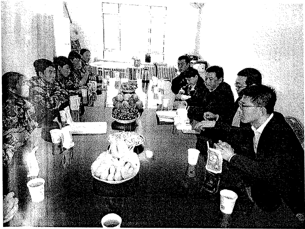
学院领导及公司代表听取实习学生的建议，实习学生相互交流并向领导汇报实习工作及自身存在的不足与今后努力的方向。