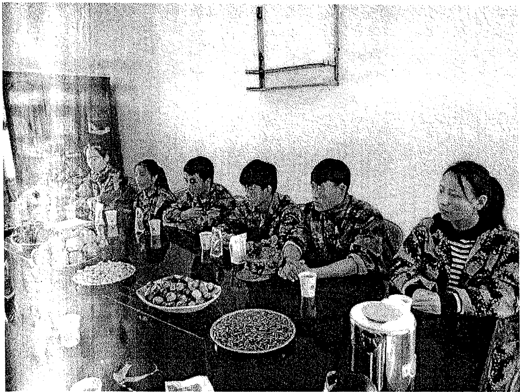
通过本次对天润乳业的考察，感触与以往明显不同，该公司牧场的养殖水平比较高端。