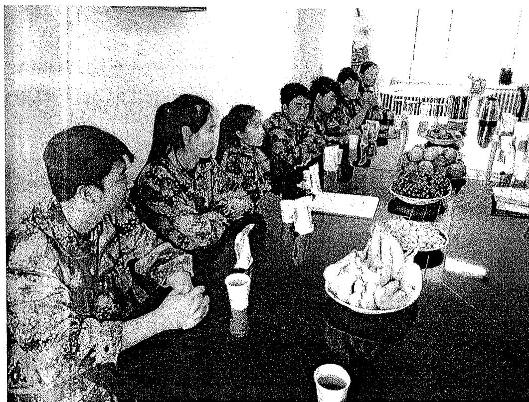
实习学生向领导汇报实习工作总结以及实习中遇到的困惑，实习生与我院领导亲切交谈。