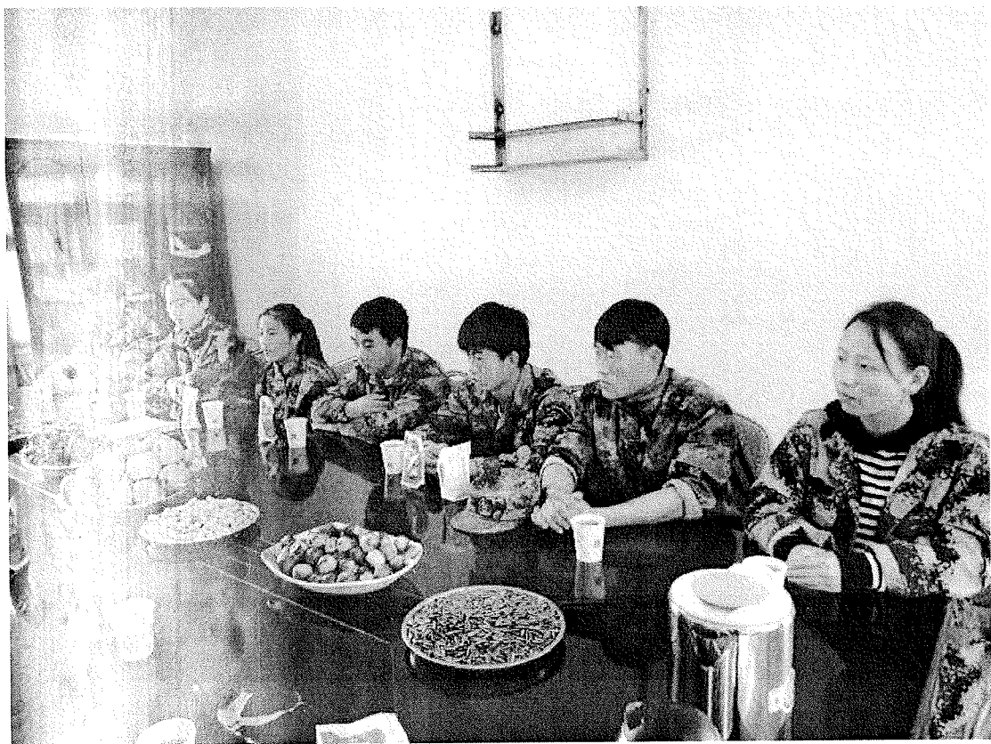
通过本次对天润乳业的考察，感触与以往明显不同，该公司牧场的养殖水平比较高端。