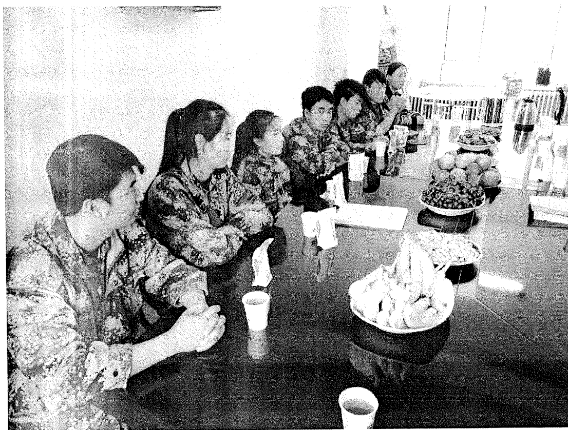
实习学生向领导汇报实习工作总结以及实习中遇到的困惑，实习生与我院领导亲切交谈。