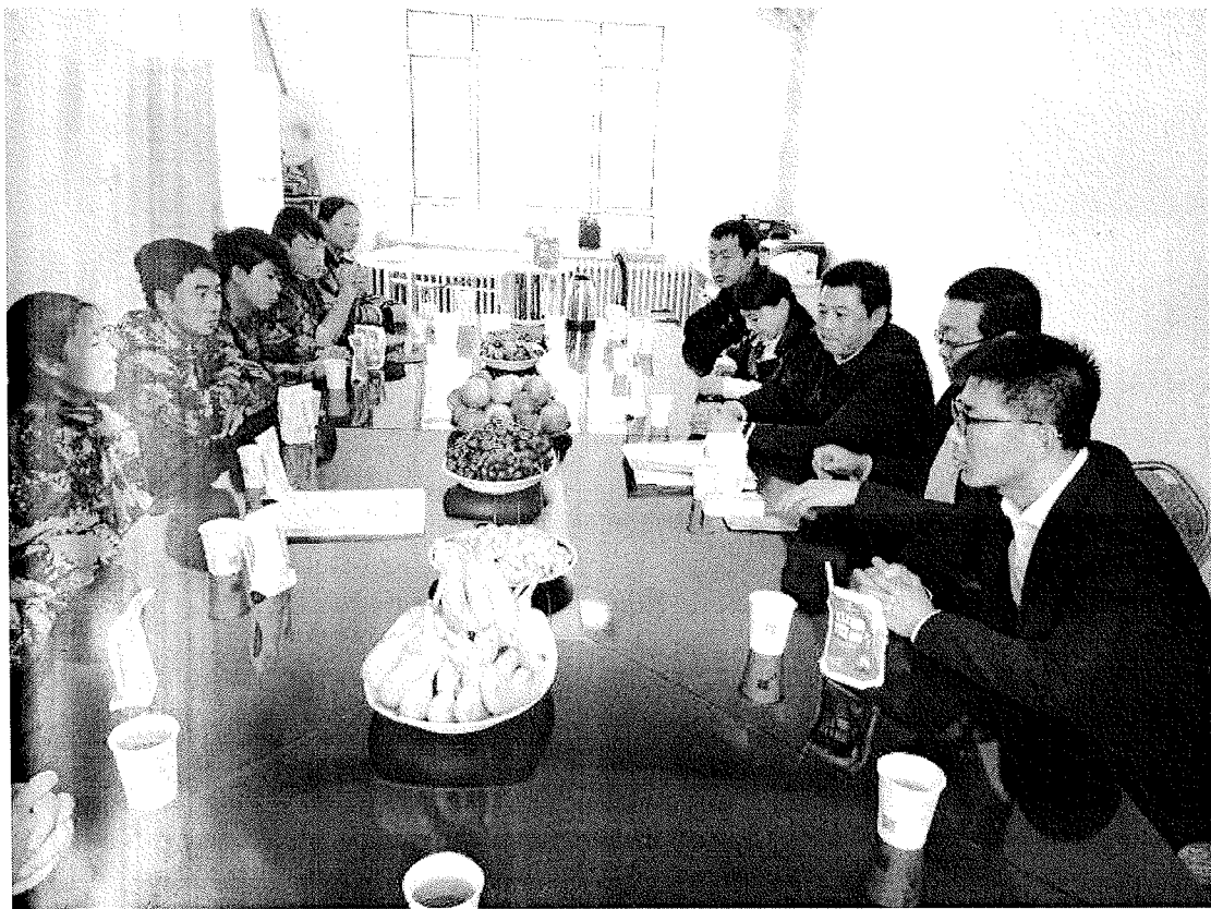
学院领导及公司代表听取实习学生的建议，实习学生相互交流并向领导汇报实习工作及自身存在的不足与今后努力的方向。