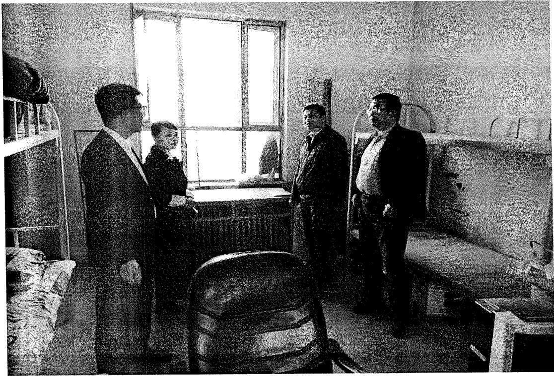
向院长和霍主任了解实习学生的住宿和伙食情况，同公司工作人员进行详细的交谈。