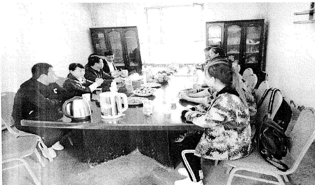
公司代表及学院领导同实习学生举行座谈会，解答实习生提出的相关问题，并听取大家的建议。